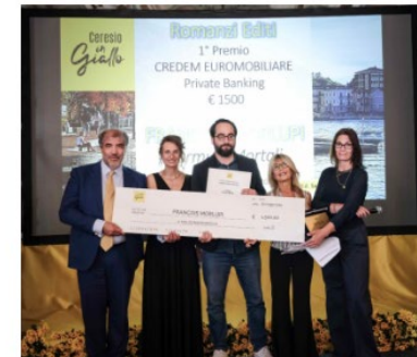
Ceresio in Giallo: il momento della premiazione