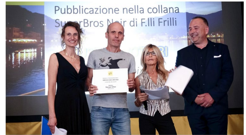
Un momento della premiazione del Concorso

La cerimonia di premiazione si è svolta nei giardini di palazzo Estense a Varese