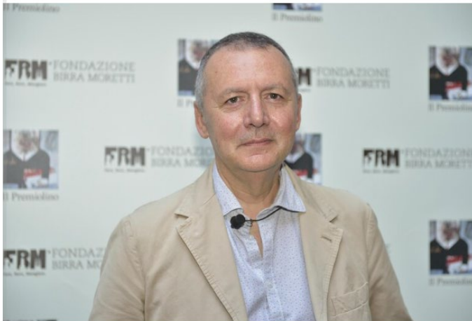
↑ - RIPRODUZIONE RISERVATA

Verrà consegnato domenica 26 maggio a Varese