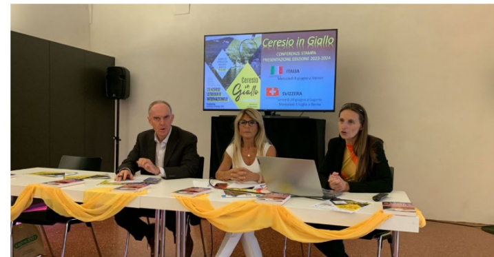
La presentazione al Lac