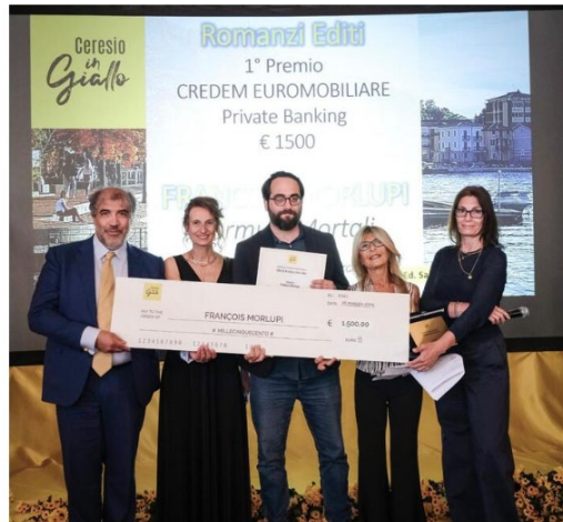
Il premio è giunto alla sua quinta edizione